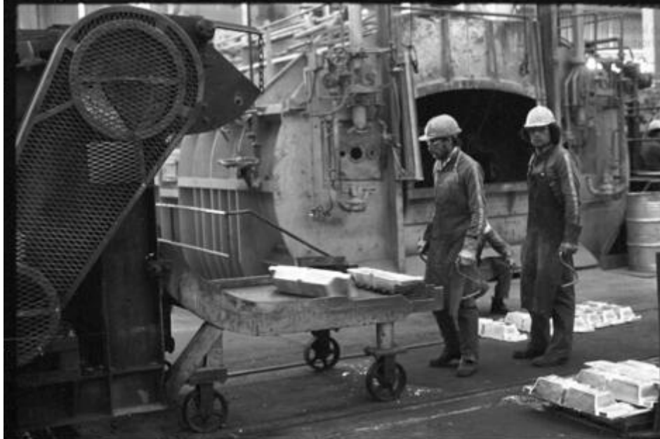
Fábrica Aluar (1980): Fuente: Archivo Nacional de la Memoria.

comités de seguridad y salud de los trabajadores y proyecto de ley de creación de los comités de salud y condiciones y medio ambiente de trabajo, en toda empresa, con participación de trabajadores y empleadores, presentado por Guillermo Estévez Boero (Expediente 2685-D-1988).