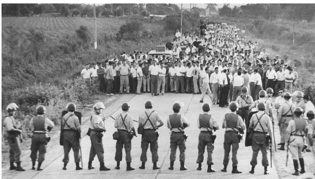
Tras el cierre de los ingenios, trabajadores y trabajadoras resistieron las medidas con ollas populares, paros y cortes de ruta.

Por decreto N° 1872/65 se designó una Comisión Redactora de un Código del Trabajo y Seguridad Social. En mayo 1966, la comisión presentó la propuesta de código que introducía el título "VII.- Higiene y seguridad en el trabajo". Un nuevo golpe de Estado dejó trunco este proyecto.