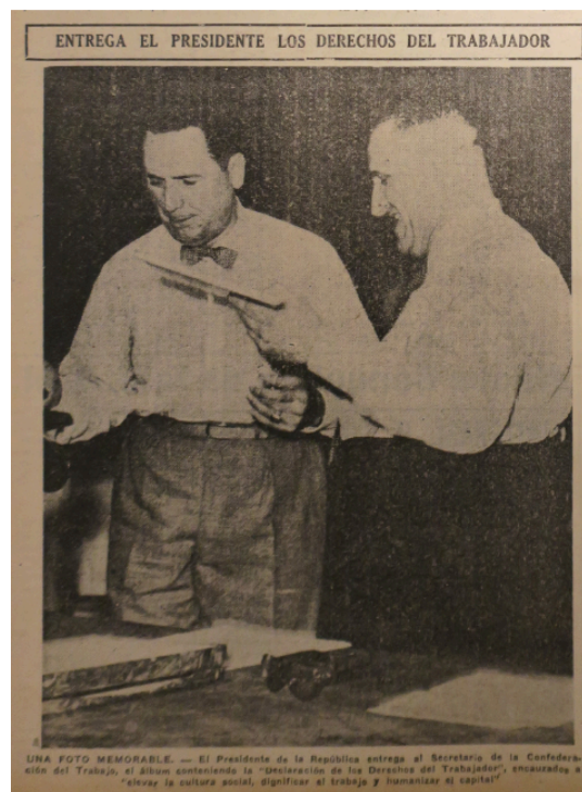
Proclamación del Decálogo de los Derechos del Trabajador.