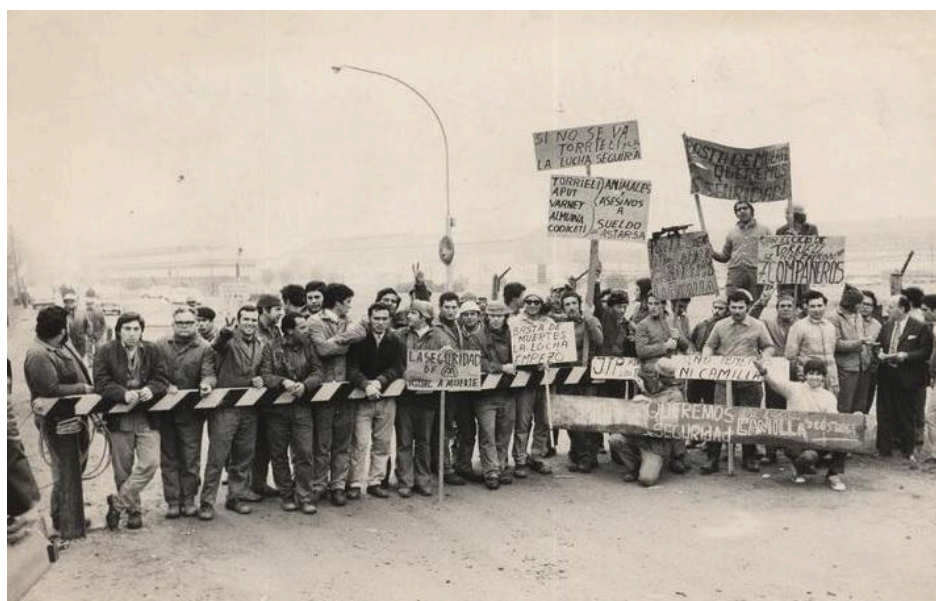
Toma de Astarsa (1973).

el golpe de estado (marzo 1976) no murió ningún obrero en Astarsa.