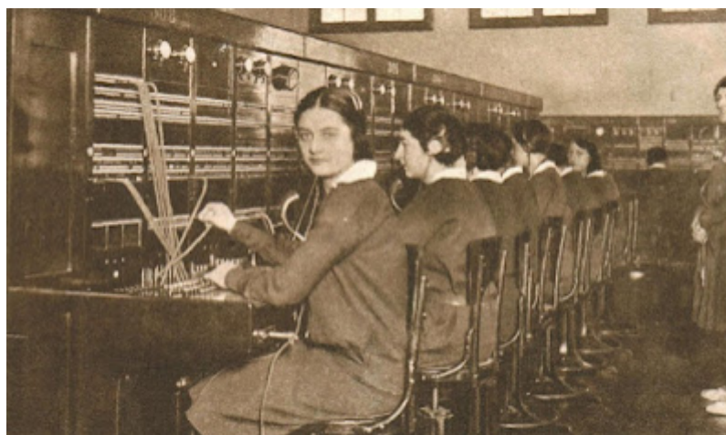
Telefonistas de la Unión Telefónica - Archivo Ex Entel. Fuente: D. Barrancos.

En 1915 se sancionó y promulgó la Ley 9688 de Accidentes del Trabajo y al año siguiente se reglamenta mediante Decreto sin número del 14/1/1916.