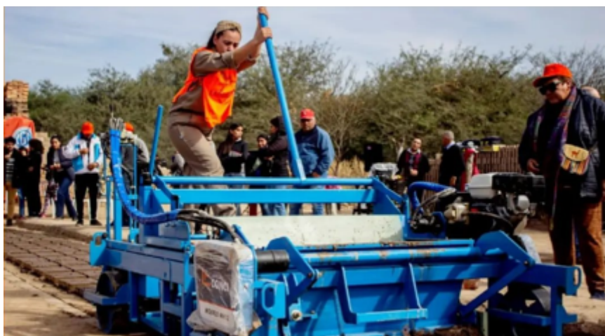
Trabajadora Ladrillera en Santiago del Estero.

En 2006, el diputado Binner reprodujo el proyecto de "Ley de Comités de Salud y Condiciones y Medio Ambiente de Trabajo", del diputado Estévez Boero (1988).